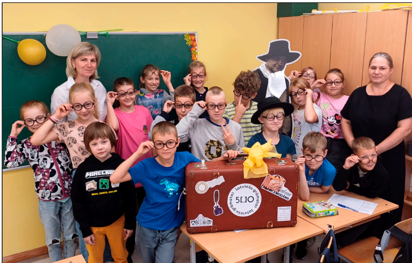
Plūdoņa lasāmčemodāns kopā ar Ceraukstes pagasta Ceraukstes bibliotēkas vadītāju viesojas Griķu pamatskolā.

Tematisko trīsradi – bibliotēka, grāmata, Plūdons – lielākās un mazākā grupās piedzīvoja Bauskas novada bibliotēku pakalpojumu lietotāji Ceraukstē, Skaistkalnē, Mūsā, Strēlniekos, Mežotnē, Vecumniekos, Misā, Vecsaulē, Bauskā, Ozolainē, Gailīšos, Vallē, Codē, Jauncodē un Iecavā. Lielākoties bērni, jaunieši un seniori ar Plūdoņa vārdu tikās bibliotēkās, bet neiztrūka arī došanās uz skolām un dienas centru. Kopumā vairāk nekā trīs simti dalībnieki bija klātesoši lasāmčemodāna idejai Viļa Plūdoņa simtpiecdesmitgadē. Vēršanās pie dažādu paaudžu cilvēkiem lasāmčemodāna saturam un stāstījumam lika variēt, bet vēstījums palika nemainīgs. Proti, valoda ir itin sarežģīts instruments un tās lietojums strauji mainās, tāpēc par tās kodolu jātur cilvēks ar grāmatu rokās.