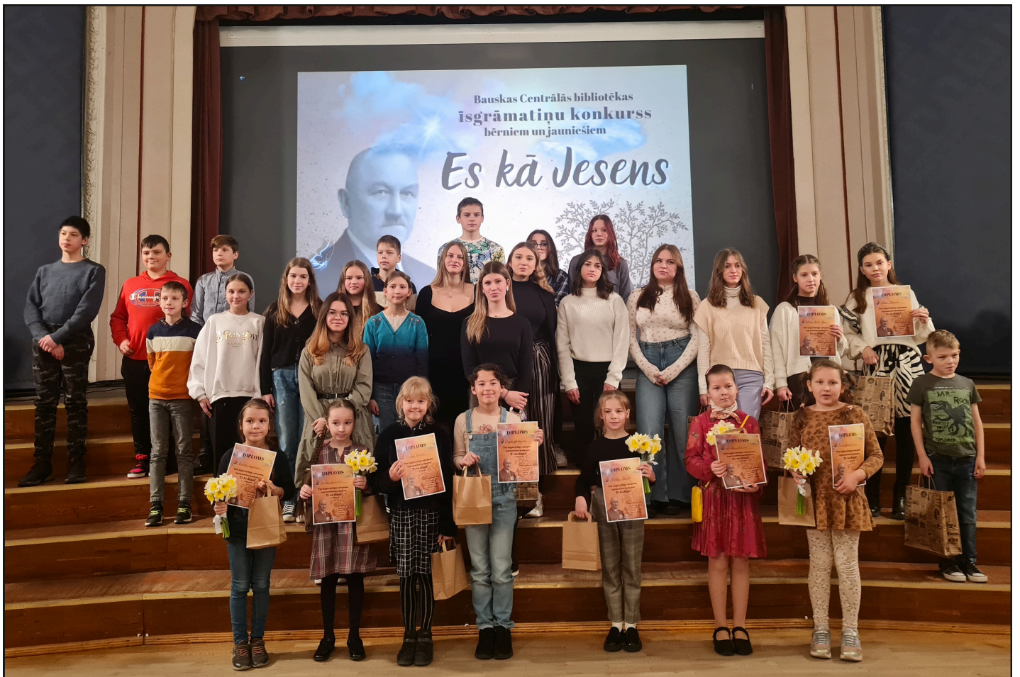
Īsgrāmatiņu konkursa "Es kā Jesens" noslēguma pasākuma dalībnieki.

Diplomus par augstvērtīgu darbu piešķīra četrās kategorijās, iepriecinot 18 bērnus un jauniešus. Sumināto autoru veikums bija vērojams uz lielā ekrāna, kurp grāmatiņas bija pārnestas digitālā formātā. Mazo klašu grupa pārsteidza ar spēju saskatīt dzejoļos sīkas nianšes un ekspresīvi attēlot notikumus, piemēram, gaiļa kājas izbradātu vijolīti (V. Ļūdēns "Vijolīte") vai stārķa negausīgo attieksmi pret iemīlējušos vardi (V. Plūdons "Starks un varde"). Savukārt lielo klašu grupā uzplaiksnīja un mazajās lappusēs iemūžinātas paliks atmiņas par pirmā piena zobu izkrišanu, gliemežu un varžu māju būvniecību, zemeņu ievārījuma vārīšanu, mācīšanos braukt ar divriteni, kopā ar opi piedzīvoto bismārīšu uzlidojumu un daudzi citi patiesi aizkustinoši stāsti.