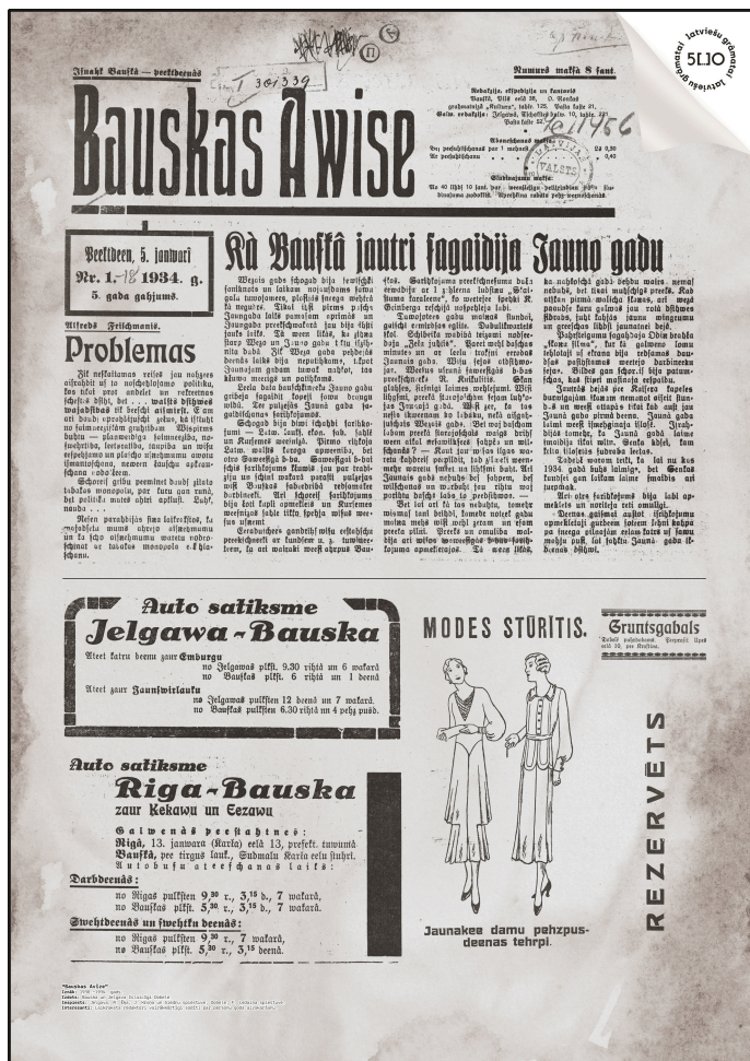
Divu lielformāta planšetņu vizuālais risinājums izstādei "Laikraksti Bauskā" (izšķirtspēja ievērojami samazināta). Ziņas no laikrakstiem "Sludinājumi" (preses aizsācējs Bauskā) un "Bauskas Avize".