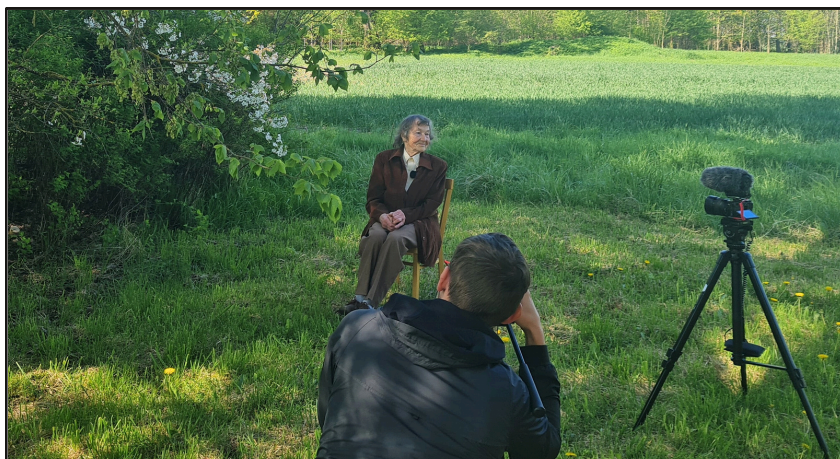
Fotoattēli no video esejas "Andreja tecīņas" ņemšanas dienas 2023. gada 12. maijā Gailīšu pagasta "Rutkos".